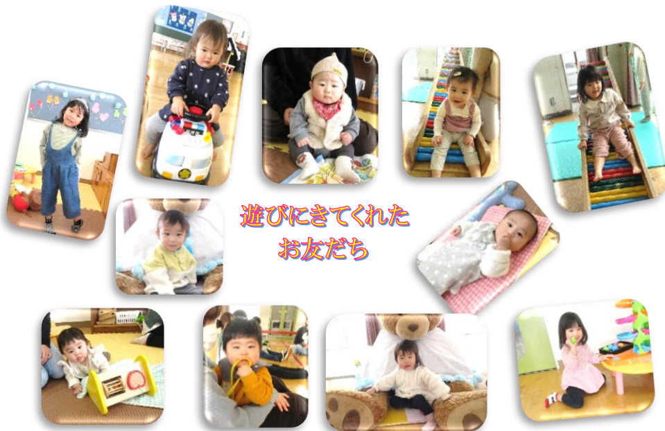
遊びにきてくれた お友だち